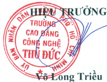
Võ Long Triều